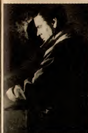
brühen Ganoven zu, deren zum Einbruch trifft.